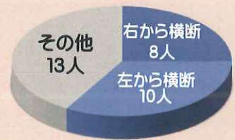
ドライバーから見た行動別グラフ